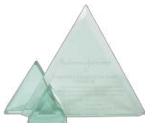
PREMIO AL COMPROMISO 2007 JOHNSON & JOHNSON

Queremos compartir el premio otorgada por la ARL AXA COLPATRIA Primer Puesto "Trabajo Seguro" 2015 por la reducción de Accidentalidad Cero (0) en los últimos tres años.