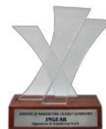
PREMIO A LA EXCELENCIA 2011 TECNOQUÍMICAS

Respaldando el alto nivel y la excelencia en el cumplimiento de los estandares de seguridad y riesgos laborales.