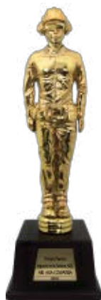
PRIMER PUESTO ARL AXA COLPATRIA 2015

Avalando nuestra Calidad y los resultados positivos en el mejoramiento de la Competitividad, Calidad y Servicio.